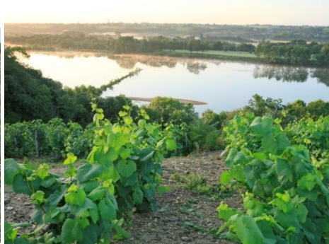
La Loire au Cellier